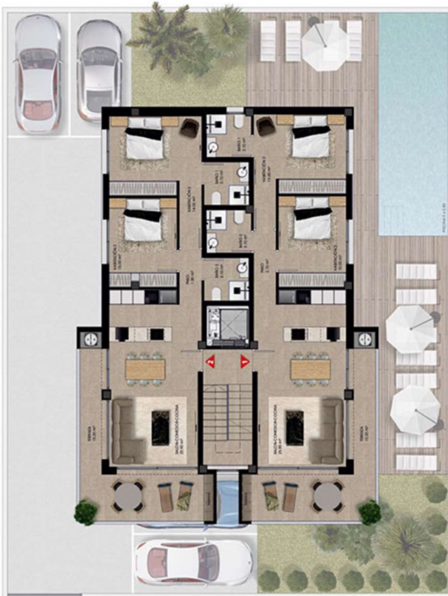
PLANTA PISO TIPO 1-2